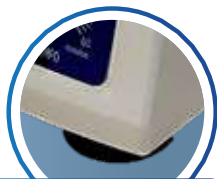
PÉS DE BORRACHA

Não permite o funcionamento com a tampa aberta ou interrompe o processo ao abrir a tampa