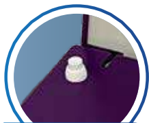
BOTÃO DE SEGURANÇA

Não permite o funcionamento com a tampa aberta ou interrompe o processo ao abrir a tampa