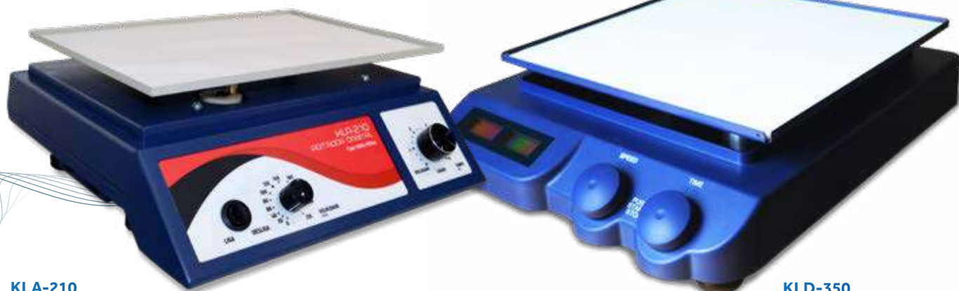
KLA-210 Analogico até 210rpm