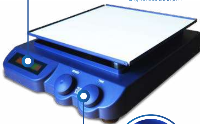
KLD-350 Digital até 350rpm

✓ Controle de velocidade e tempo da operação