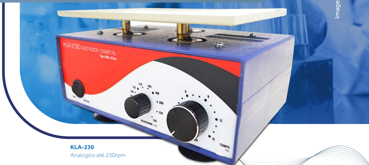
KLA-230 Analogico até 230rpm