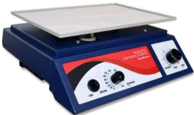
KLA-210 Analogico até 210rpm