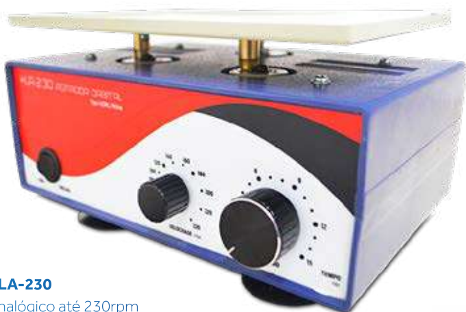
KLA-230 Analogico até 230rpm